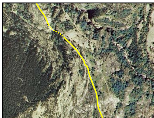
Ejemplo de Cremallera .